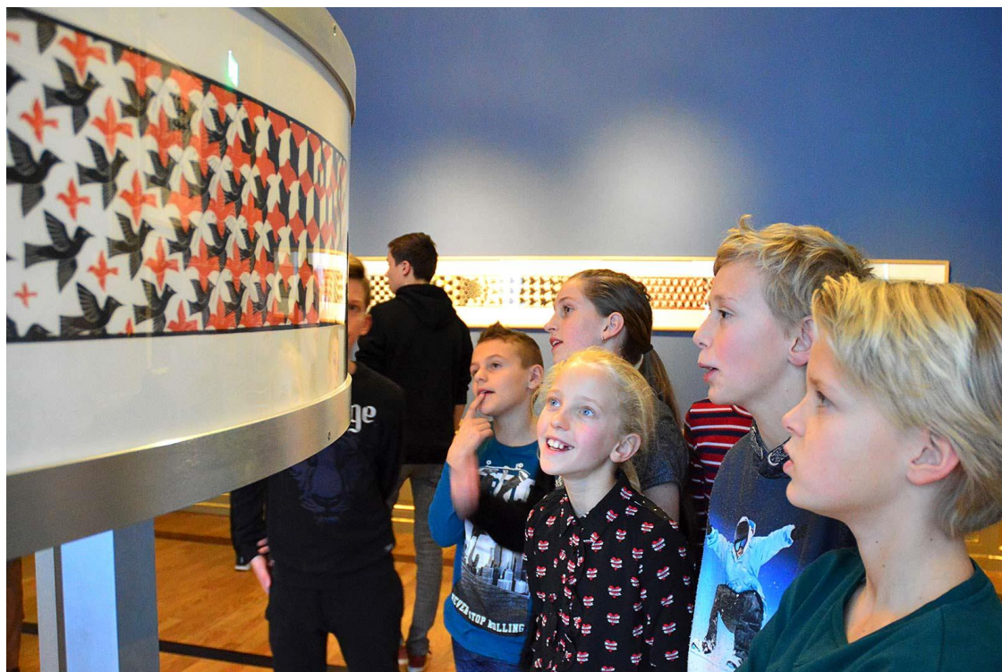
Leerlingen bekijken samen een kunstwerk