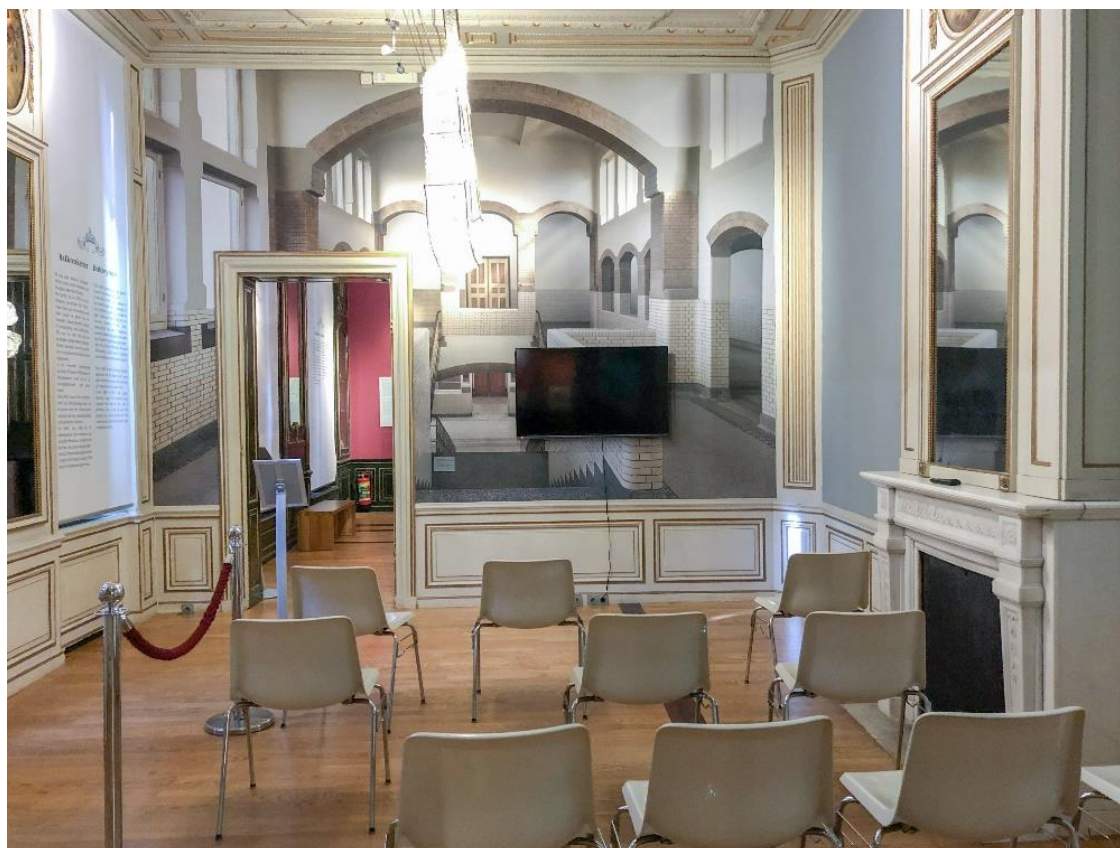
De filmzaal, met prints aan de muur van de binnenkant van Eschers middelbare school

Aan de muur zie je grote fotoprints van de binnenkant van Eschers middelbare school.