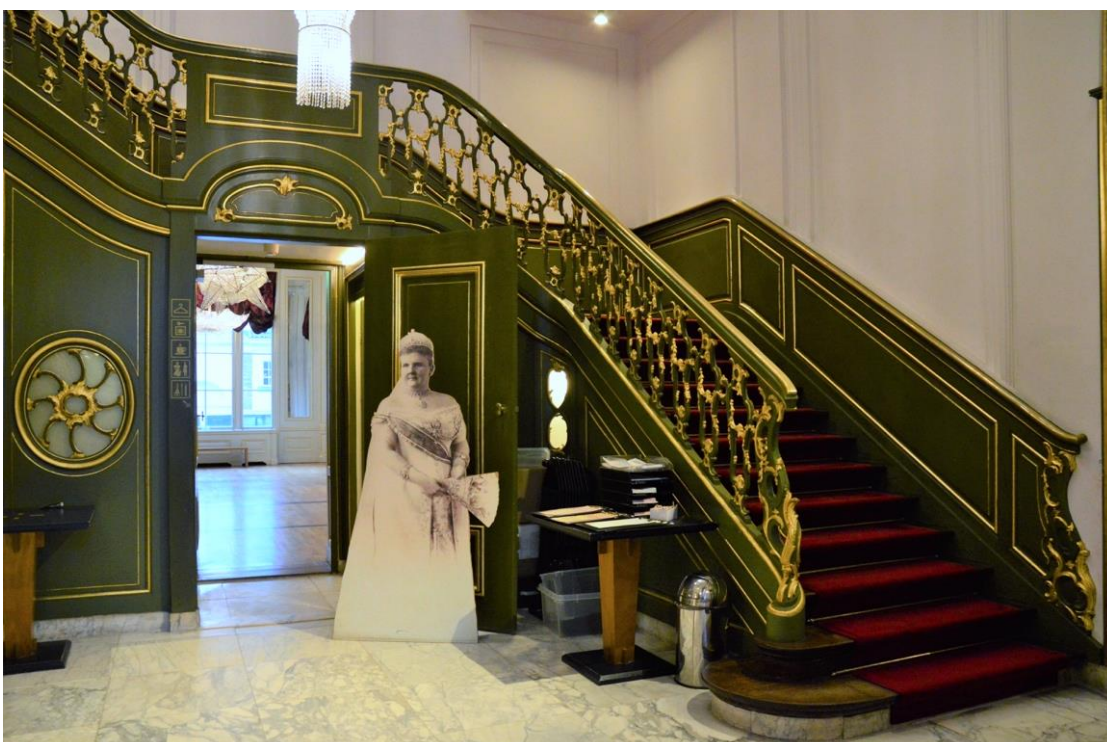
De centrale hal met trap