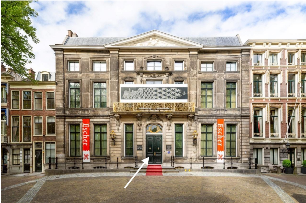
De voorkant van het museum.

Op de foto zie je de voorkant van het museum. De ingang staat aangegeven met de witte pijl. Vroeger was dit gebouw een koninklijk paleis. Nu is het in gebruik als een museum en kun je er beroemde kunstwerken van M.C. Escher zien.