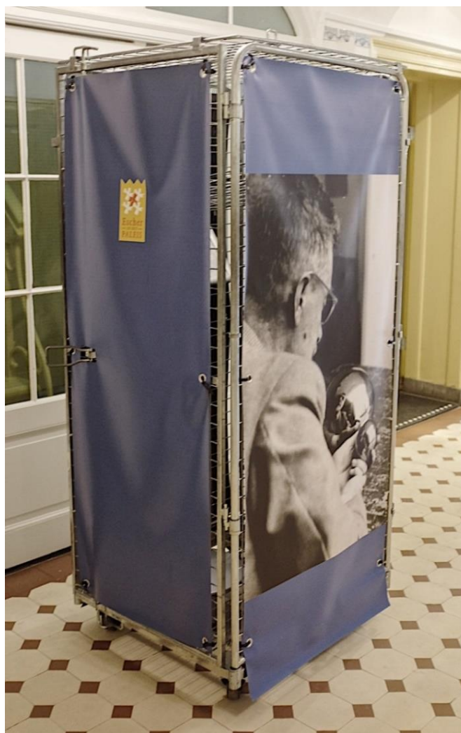
De rolcontainer voor de tassen

Alleen kleine handtassen mogen mee het museum in. Er is een rolcontainer waar de rugzakken en grotere tassen in kunnen worden opgeborgen. De rolcontainer wordt afgesloten met een hangslot door de museumdocent. Op de rolcontainer staat een foto van de kunstenaar M.C. Escher of een foto van het paleis zoals het vroeger was. Aan het einde van de museumles worden de tassen er weer uitgehaald.