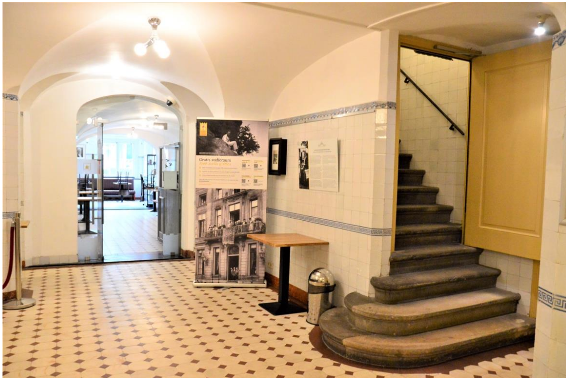
De stenen trap naar het souterrain. Achterin is het museumcafé.

Samen met de museumdocent loop je de stenen trap af naar beneden. Zo kom je in de kelder. Die noemen we ook wel het souterrain. Daar is de garderobe om je jas en tas op te bergen. Hier zijn ook de toiletten, de kluisjes, het atelier en het museumcafé. Omdat het een oud gebouw is, kan het hier een beetje anders ruiken dan je misschien gewend bent.