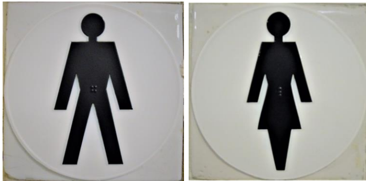
De wc-borden die op de muur naast de toiletten hangen.

De toiletten vind je in het souterrain naast het atelier. Er is helaas geen toilet voor rolstoelgebruikers in het museum.