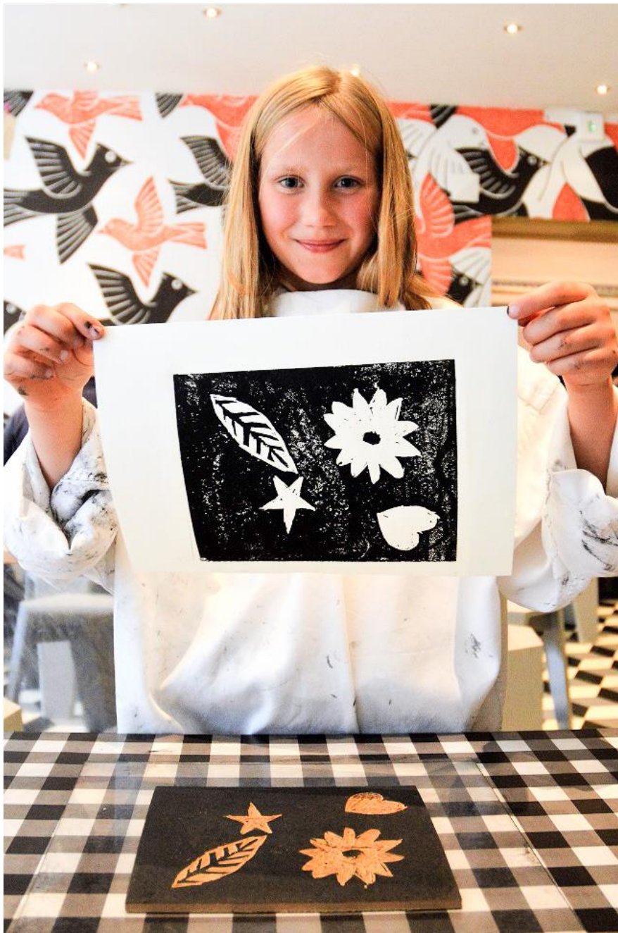
Leerling in het atelier tijdens een linoleumdruk workshop